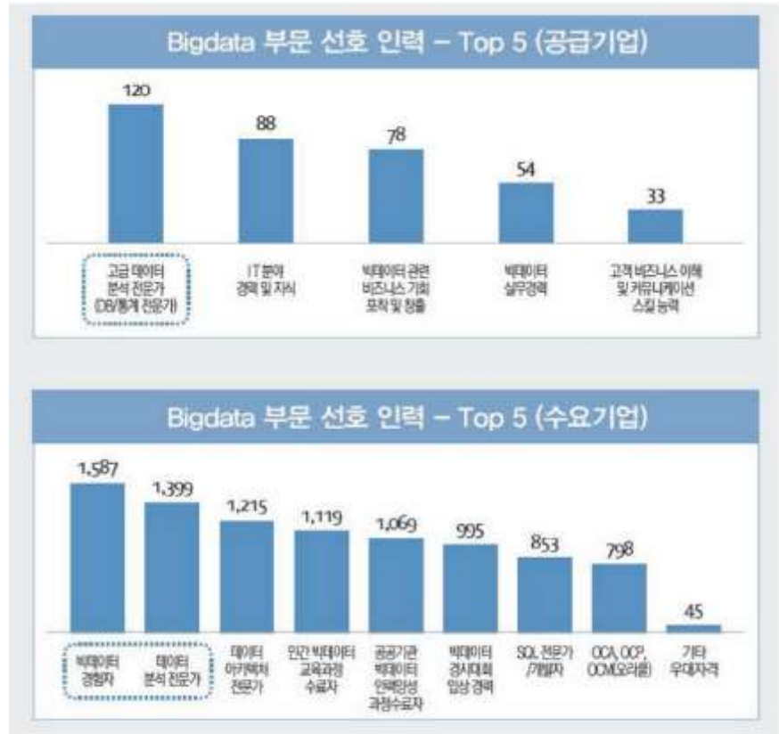
빅데이터 공급기업과 수요기업이 선정한 부문별 선호인력 순위