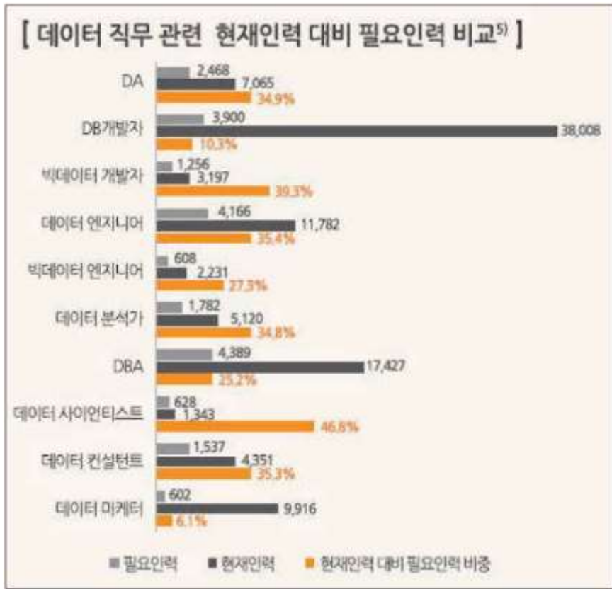
국내 데이터 직무 관련 현재 인력 대비 필요인력 비교. 한국정보화진흥원 제공